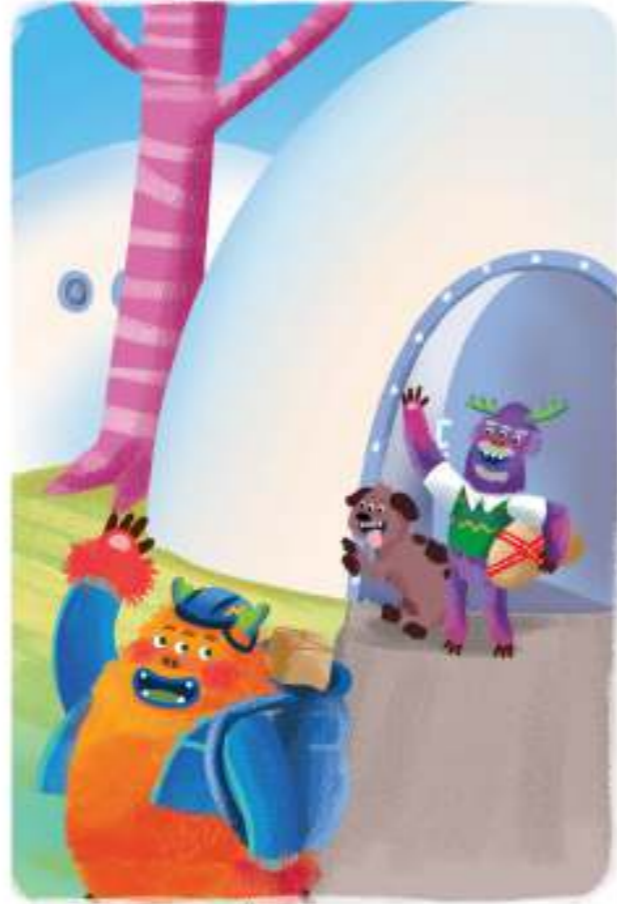
Kini, Gempol tak dikenal sebagai si kurir lambat lagi.